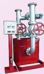
↑バイソンサイクロン