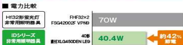
IDシリーズ 非常用照明器具 40形

LEDに交換し 消費電力の削減 はもちろん、 「施設内雰囲気も明るくなりライトバーのデザインにも満足している」 と担当者様より好印象を持って頂けた。